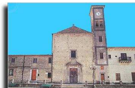
Convento di S. Francesco, sede del corso